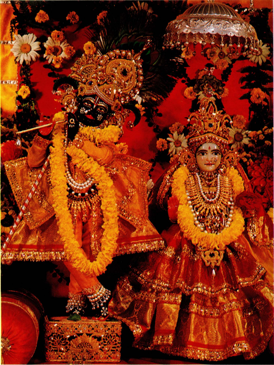
Die Bildgestalten von Śrī Śrī Rādhā-Ṣadana-mohana im Nava-Jiyāḍa-Nṛsimha-Tempel im Bayerischen Wald.