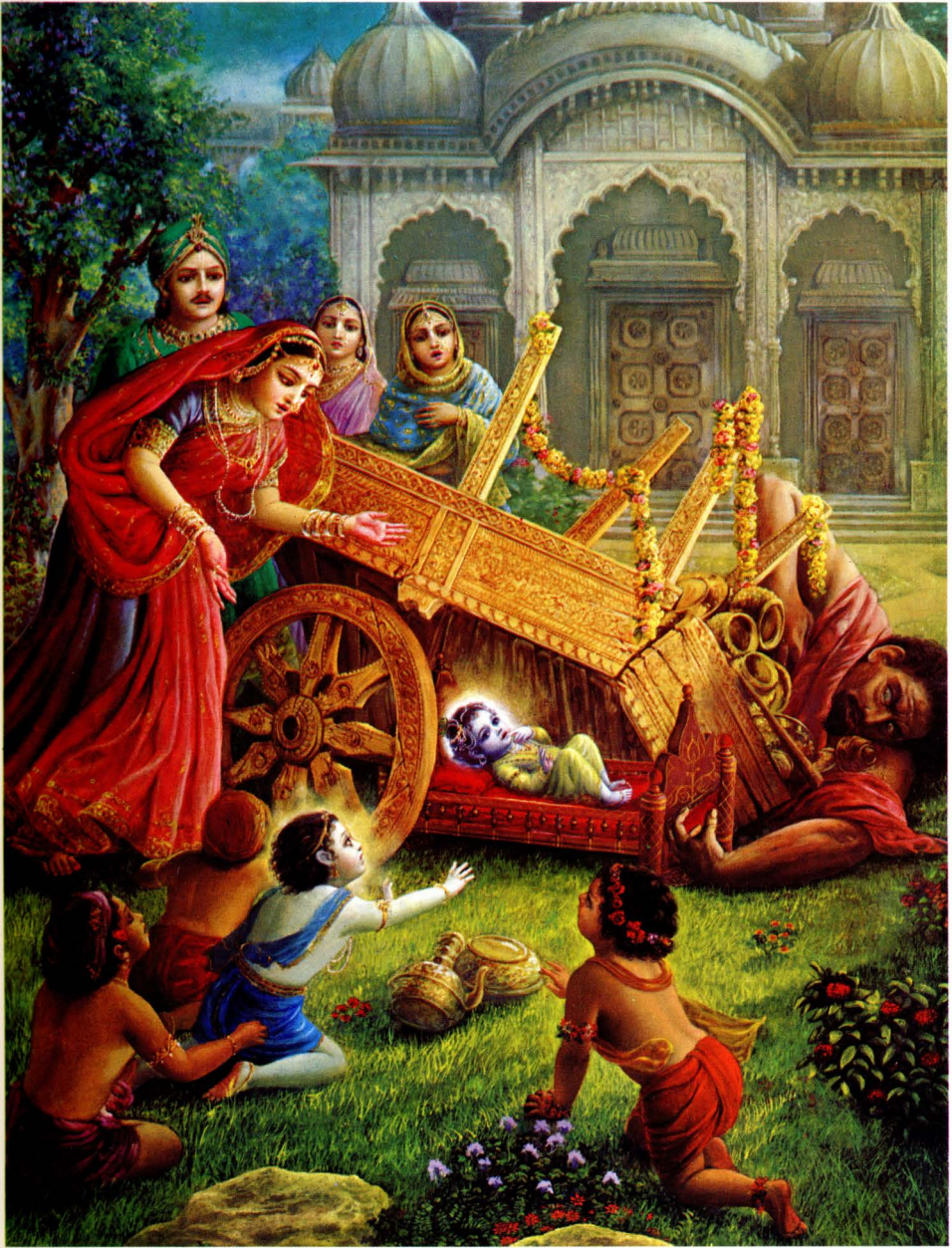
Im Alter von drei Monaten tötete Kṛṣṇa den Dämon Śakaṭāsura, der die Gestalt eines Wagens angenommen hatte, durch einen Fußtritt. (S. 331-332)