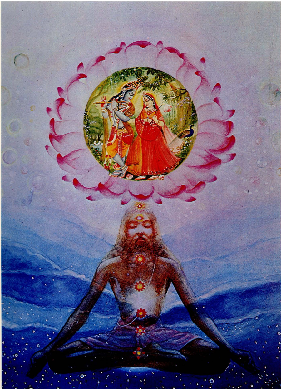
Der bhakti-yogī sollte die Lebensluft hochdrücken und zwischen den Augen sammeln, und dann – nachdem er die sieben Ausgänge der Lebensluft verschlossen hat – sollte er an sein Ziel, die spirituelle Welt, denken. (S. 83)