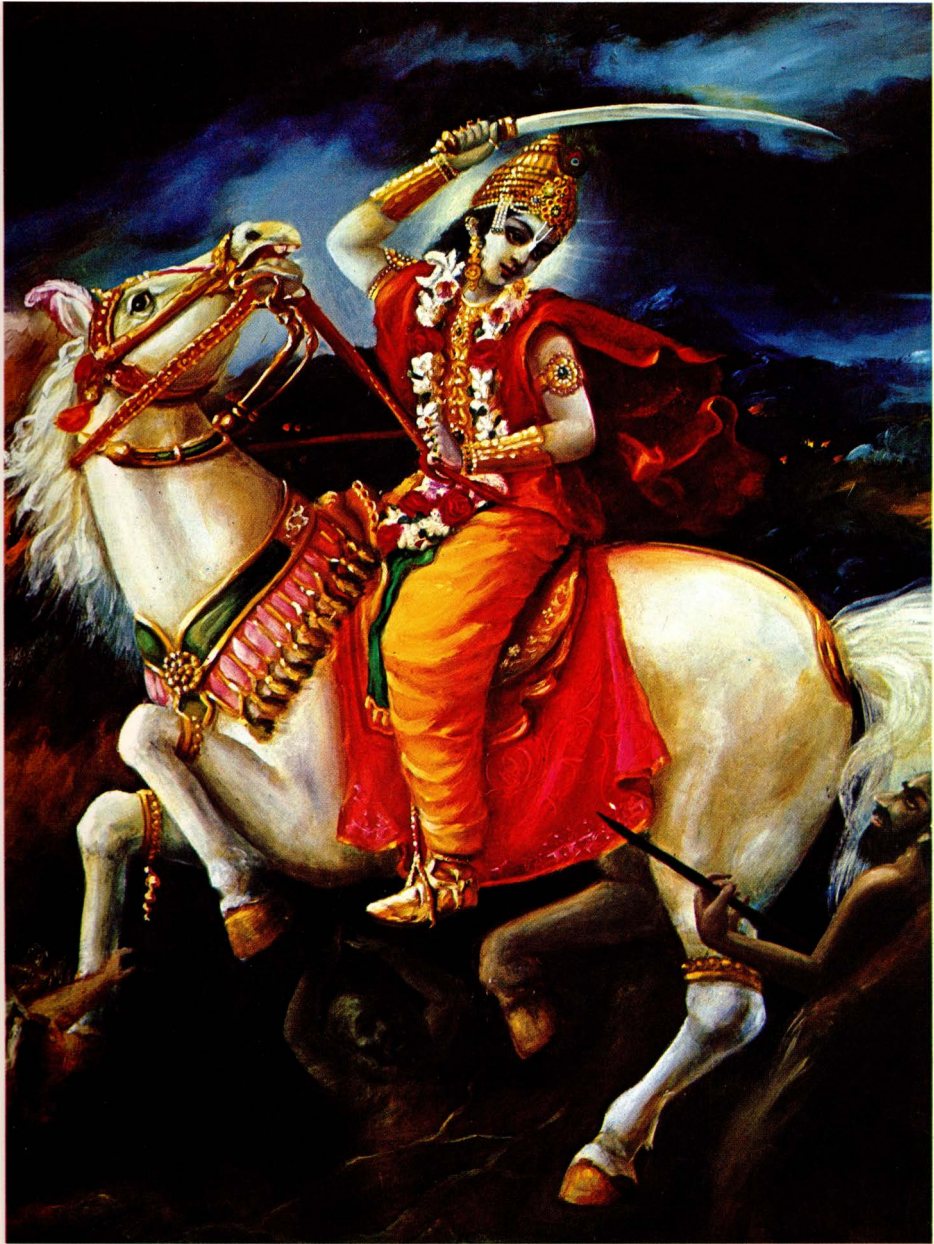
Danach, am Ende des Kali-yuga, wenn kein Wort mehr über Gott gesprochen werden wird, wird der Herr als Kalki-avatāra erscheinen und alle Dämonen erbarmungslos töten. (S. 344-345)