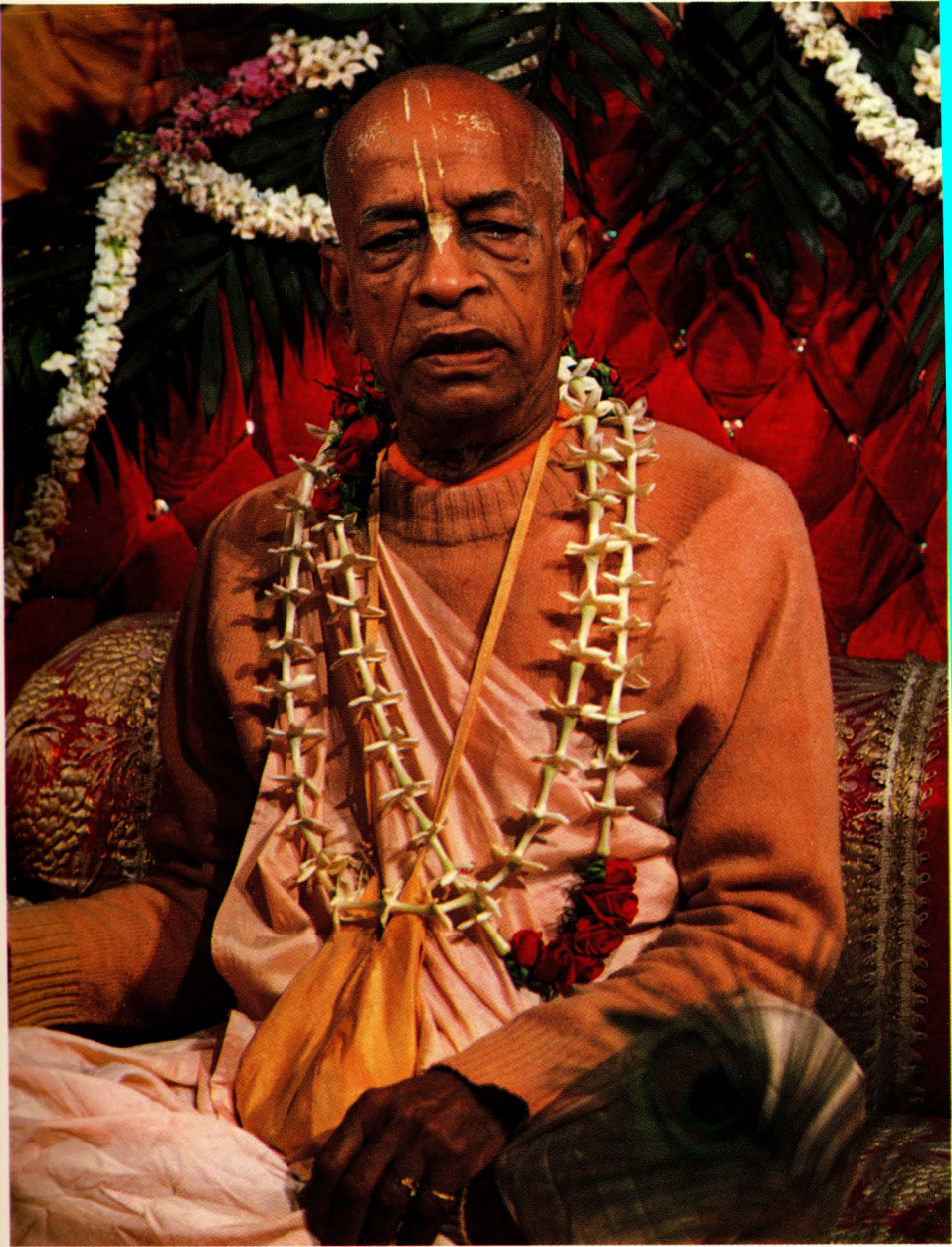
His Divine Grace A.C. Bhaktivedanta Swami Prabhupāda Gründer-Ācārya der Internationalen Gesellschaft für Krishna-Bewußtsein